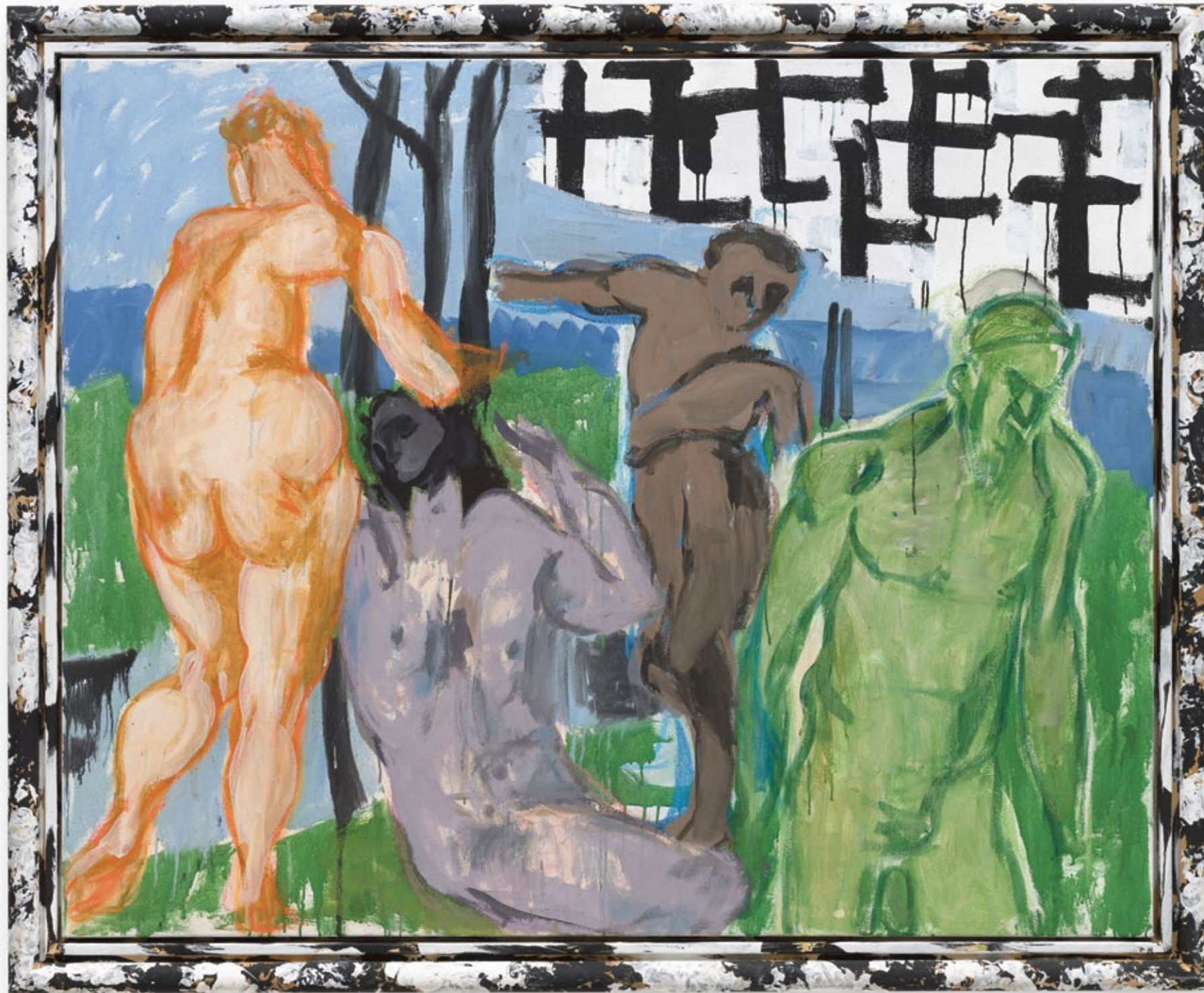
Markus Lüpertz, Abschied , 2016, Mischtechnik auf Leinwand, 130 x 162 cm