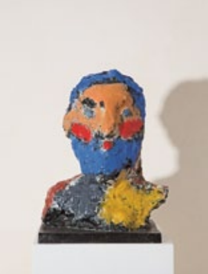
Herkules , 2009 Entwurfsmodell 19 – Büste Bronze bemalt 40 × 27 × 22 cm Auflage 6