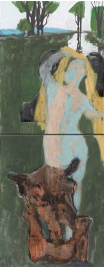
Der Abend (Märkisch), 2014 Mischtechnik auf Leinwand 201 × 81 cm