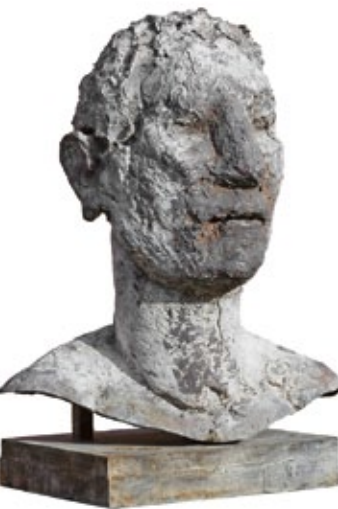
Achilles Kopf, 2014 Bronze bemalt 100 × 80 × 60 cm Auflage 6