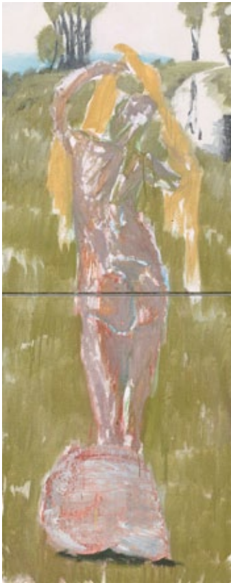
Der Mittag (Märkisch), 2014 Mischtechnik auf Leinwand 201 × 81 cm