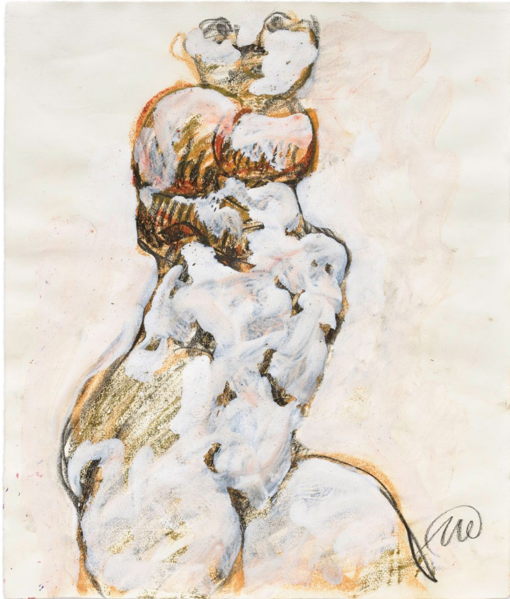
Markus Lüpertz, Ohne Titel ( Daphne ), 2003, Kreide und Gouache auf Papier, 46,5 × 39,5 cm