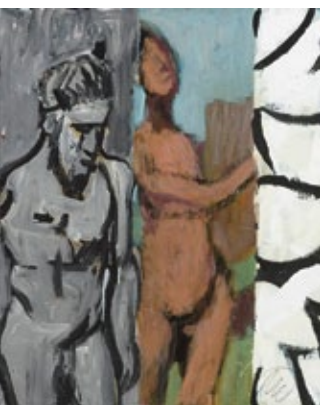
Die Gabe, 2016 Mischtechnik auf Leinwand 100 × 81 cm