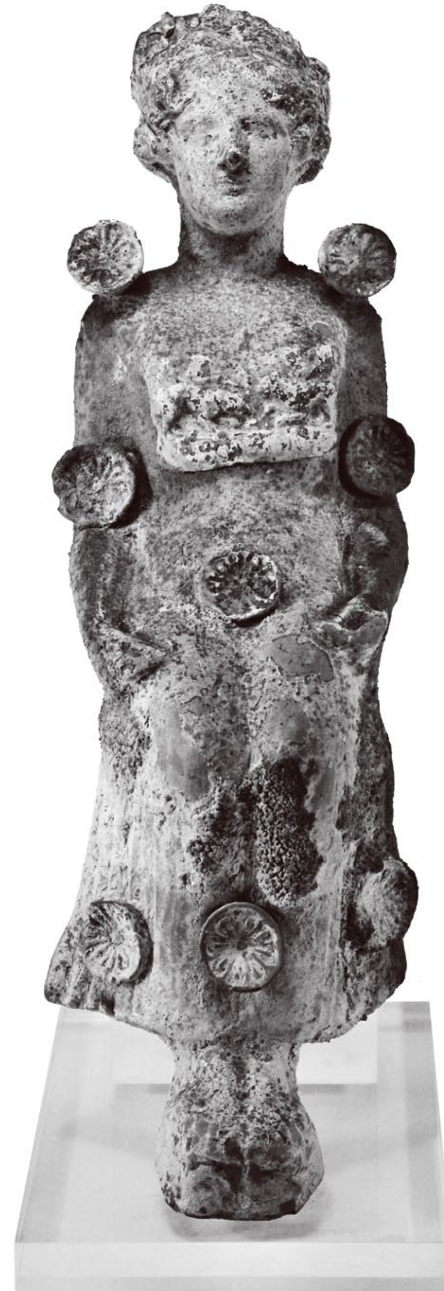
Terrakottafigur einer thronenden Göttin, Tarent um 400 v. Chr., Sammlung Ludwig, Inv. Lu 103