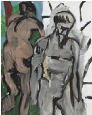
Eifersucht, 2016 Mischtechnik auf Leinwand 100 × 81 cm