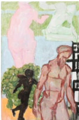
Ohne Titel, 2016 Mischtechnik auf Leinwand 227 × 115 cm