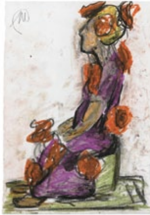
Flora , 2016 Gouache und Bleistift auf Papier 42 × 29 cm