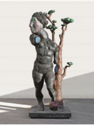
Daphne , 2003 Bronze bemalt 350 × 150 × 150 cm Auflage 3