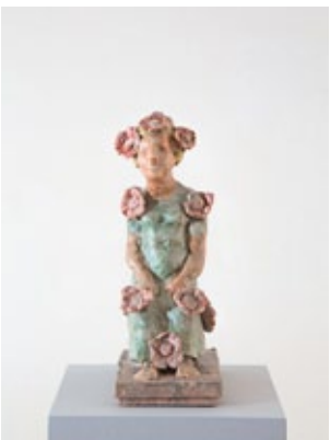
Flora, Gips mit Wachs überzogen 35 × 13,5 × 22 cm Auflage 6