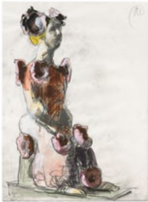
Flora , 2016 Gouache und Bleistift auf Papier 40,4 × 29,7 cm