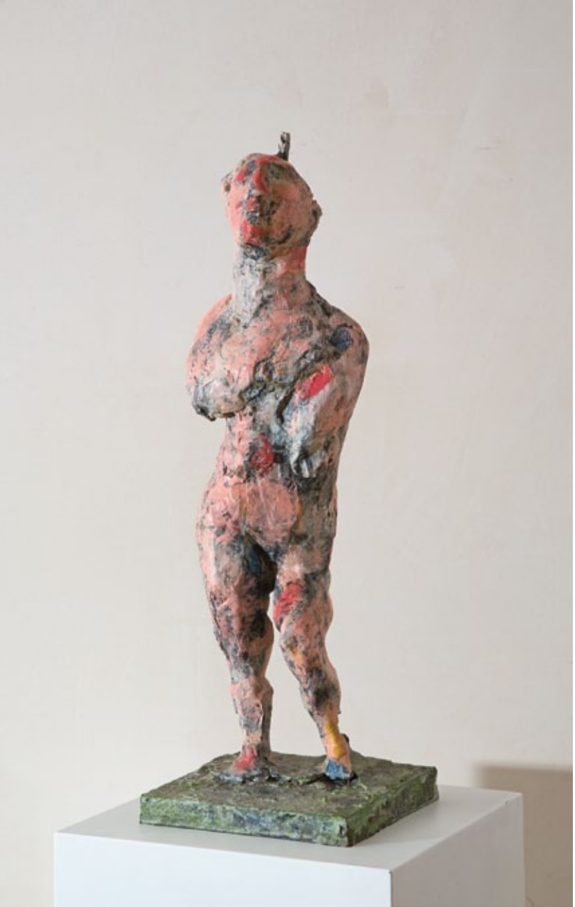
Daphne 8 (Daphne mit Nagel), 2003 Bronze bemalt 57 × 15 × 20 cm Auflage 6