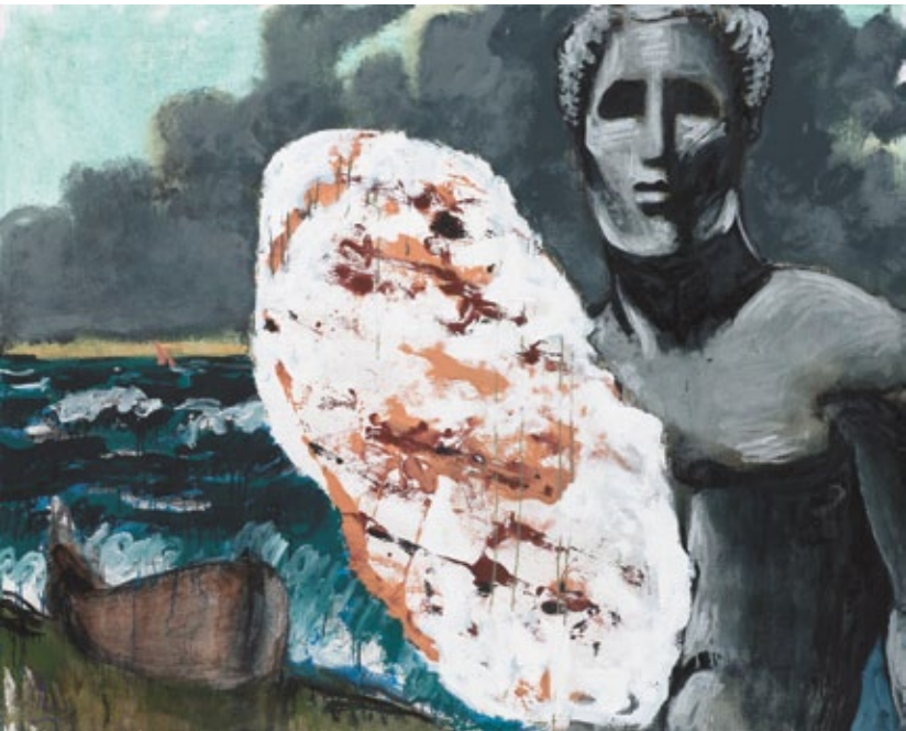
Ulysses IV, 2011 Mischtechnik auf Leinwand 130 × 162 cm