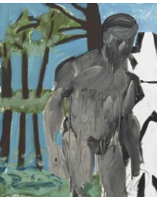
Am Rande, 2016 Mischtechnik auf Leinwand 100 × 81 cm