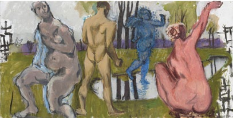
Ohne Titel, 2016 Mischtechnik auf Leinwand 112 × 227 cm