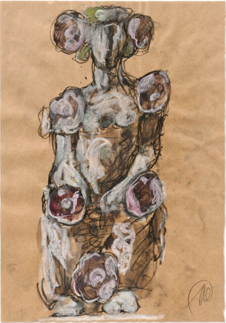
Flora , 2016 Gouache und Bleistift auf Papier 42 × 29,3 cm