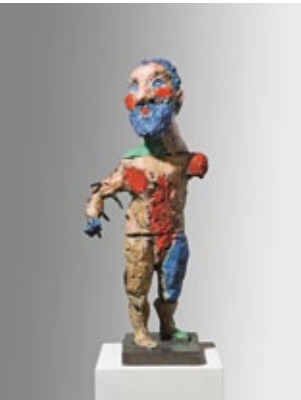
Herkules , 2009 Entwurfsmodell 21 Bronze bemalt 76 × 22 × 27 cm Auflage 6