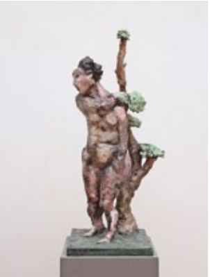
Daphne 2 , 2002 Bronze bemalt 75 × 33 × 29 cm Auflage 6