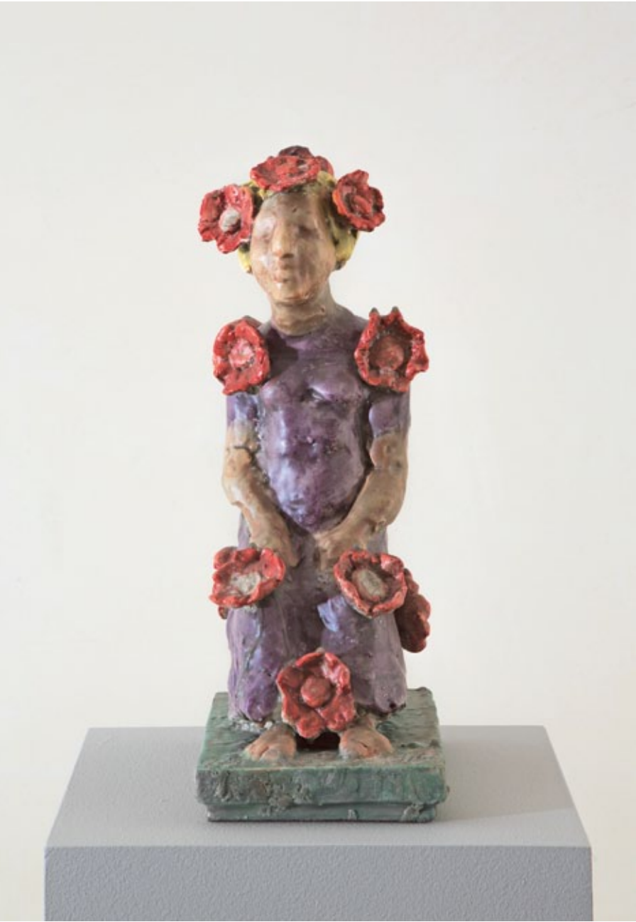
Flora , 2016 Gips mit Wachs überzogen 35 × 13,5 × 22 cm Auflage 6