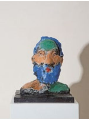
Herkules , 2009 Entwurfsmodell 14 – Büste Bronze bemalt 30 × 25 × 27 cm Auflage 6