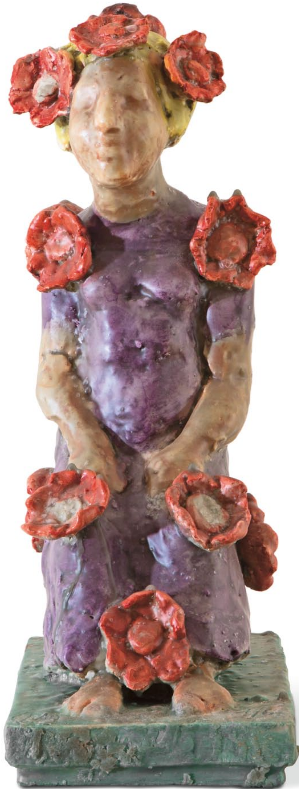
Markus Lüpertz, Flora , 2016, Gips mit Wachs überzogen, Auflage 6, 35 x 13,5 x 22 cm