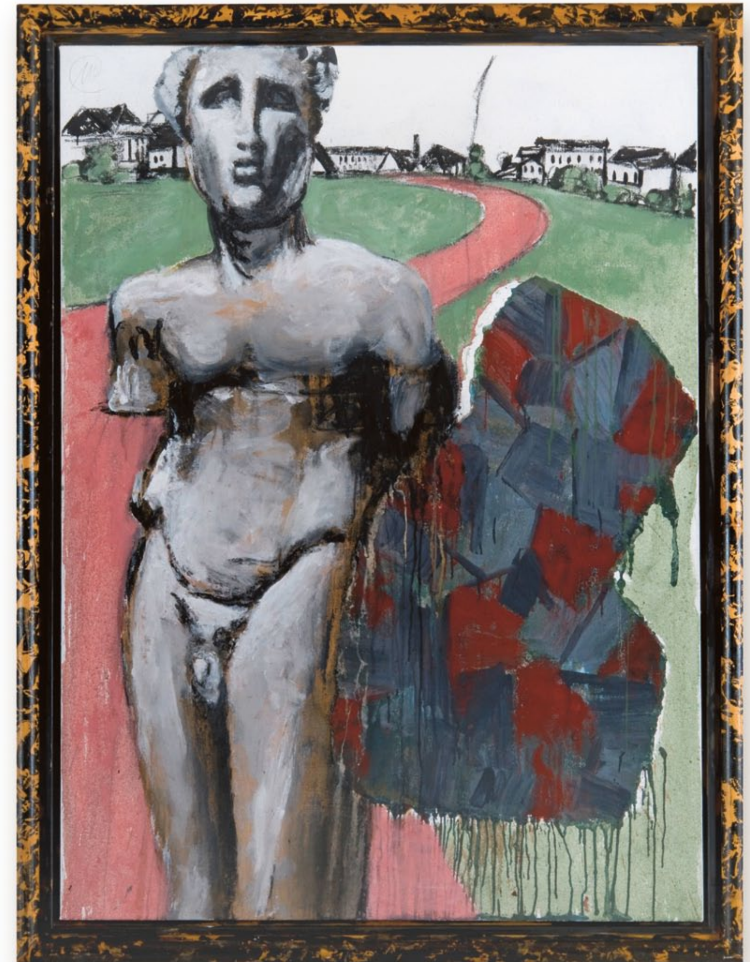
Markus Lüpertz, Wächter , 2011, Mischtechnik auf Leinwand, 162 x 118,5 cm