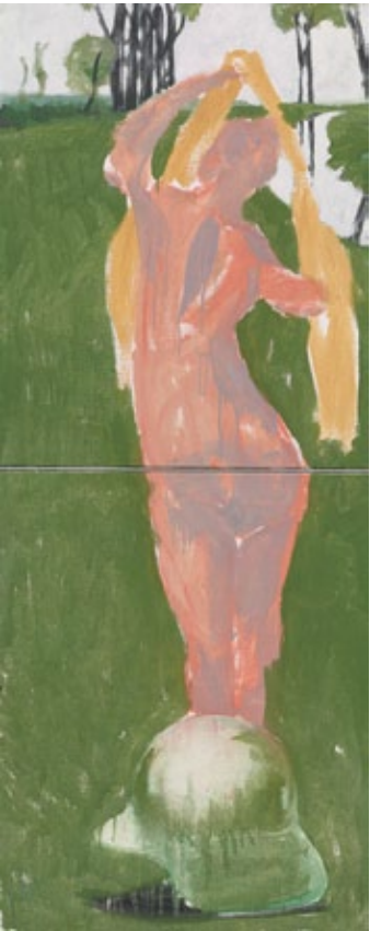
Der Morgen (Märkisch), 2014 Mischtechnik auf Leinwand 201 × 81 cm