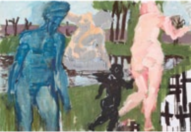
Ohne Titel, 2016 Mischtechnik auf Leinwand 121 × 174