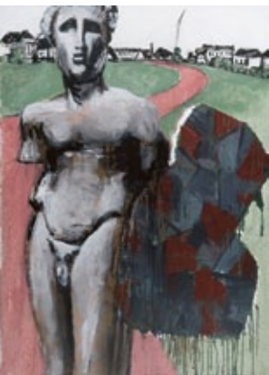
Wächter, 2011 Mischtechnik auf Leinwand 162 × 118,5 cm