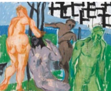
Der Abschied, 2016 Mischtechnik auf Leinwand 130 × 162 cm