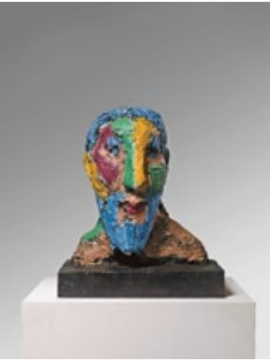
Herkules , 2009 Entwurfsmodell 7 – Büste Bronze bemalt 60 × 53 × 43 cm Auflage 6