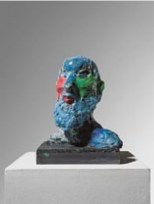
Herkules , 2009 Entwurfsmodell 8 – Büste Bronze bemalt 27 × 20 × 16 cm Auflage 6