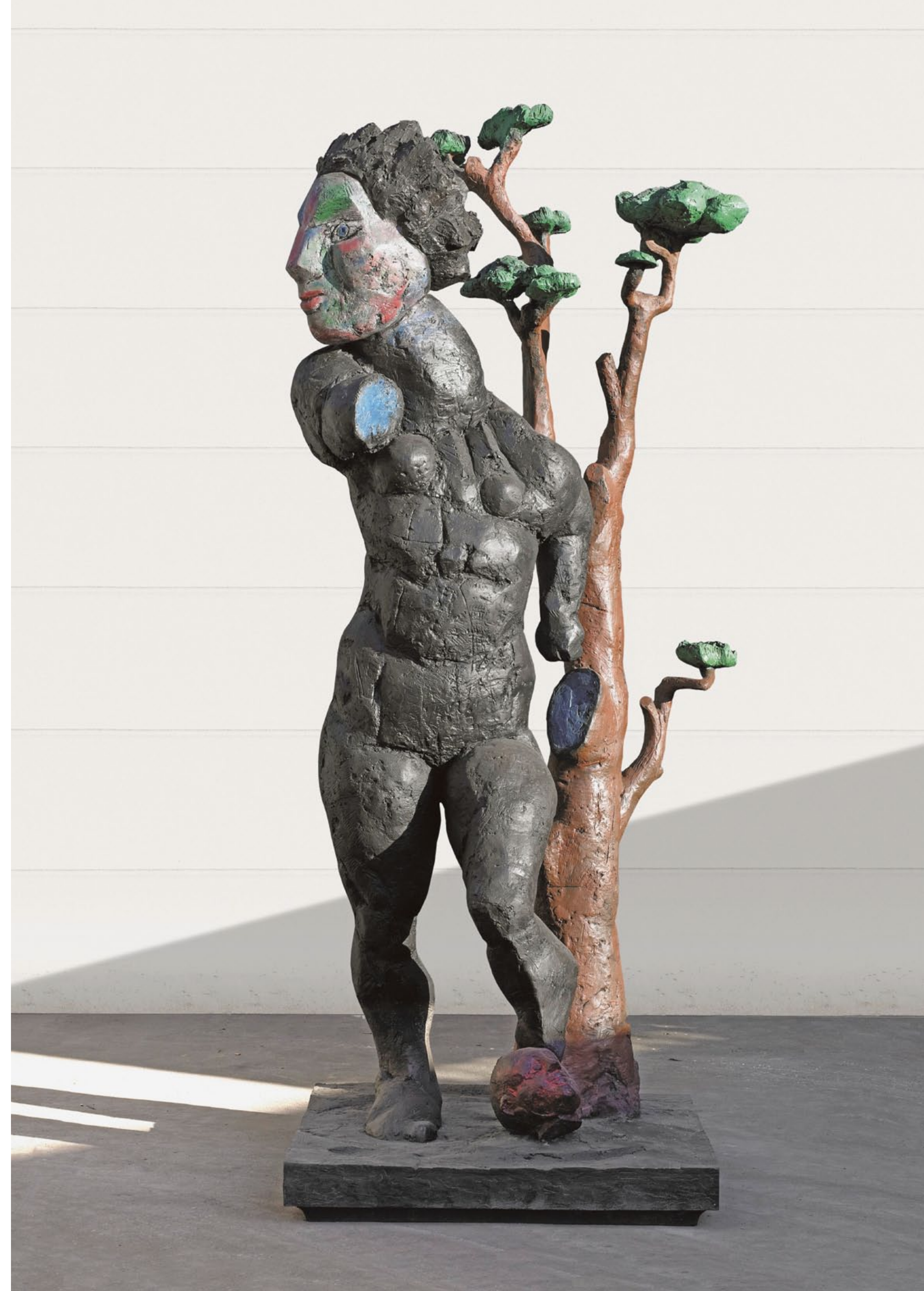
Markus Lüpertz, Daphne , 2003, Bronze bemalt, Auflage 3, 350 × 150 × 150 cm ►